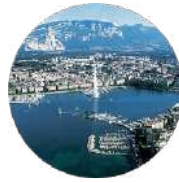
Gulf Research Center Foundation

Unit FN11A King Faisal Foundation North Tower King Fahd Branch Rd Al Olaya Riyadh 12212 Saudi Arabia Tel: +966 112112567 Email: info@grc.net