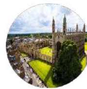
Gulf Research Centre Cambridge

Avenue de France 23 1202 Geneva Switzerland Tel: +41227162730 Email: info@grc.net