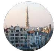
Gulf Research Center Foundation Brussels

University of Cambridge Sidgwick Avenue, Cambridge CB3 9DA United Kingdom Tel:+44-1223-760758 Fax:+44-1223-335110