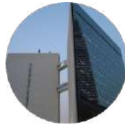
Gulf Research Center Riyadh

19 Rayat Alitihad Street P.O. Box 2134 Jeddah 21451 Saudi Arabia Tel: +966 12 6511999 Fax: +966 12 6531375 Email: info@grc.net