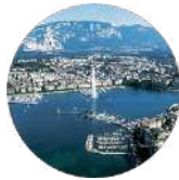
Gulf Research Center Foundation Geneva

Unit FN11A King Faisal Foundation North Tower King Fahd Branch Rd Al Olaya Riyadh 12212 Saudi Arabia Tel: +966 112112567 Email: info@grc.net