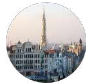
Gulf Research Center Foundation Brussels

University of Cambridge Sidgwick Avenue, Cambridge CB3 9DA United Kingdom Tel:+44-1223-760758 Fax:+44-1223-335110