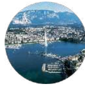
Gulf Research Center Foundation Geneva

Unit FN11A King Faisal Foundation North Tower King Fahd Branch Rd Al Olaya Riyadh 12212 Saudi Arabia Tel: +966 112112567 Email: info@arc.net