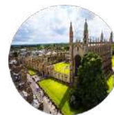
Gulf Research Centre Cambridge

Avenue de France 23 1202 Geneva Switzerland Tel: +41227162730 Email: info@grc.net