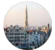
Gulf Research Center Foundation Brussels

University of Cambridge Sidgwick Avenue, Cambridge CB3 9DA United Kingdom Tel: +44-1223-760758 Fax: +44-1223-335110