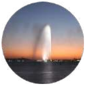
Gulf Research Center Jeddah (Main office)

19 Rayat Alitihad Street P.O. Box 2134 Jeddah 21451 Saudi Arabia Tel: +966 12 6511999 Fax: +966 12 6531375 Email: info@grc.net