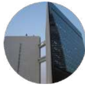
Gulf Research Center Riyadh

19 Rayat Alitihad Street P.O. Box 2134 Jeddah 21451 Saudi Arabia Tel: +966 12 6511999 Fax: +966 12 6531375 Email: info@grc.net